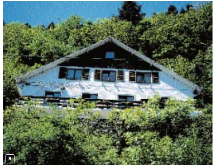
Villa Le Corumont: logeren hoog boven La-Roche-en-Ardenne